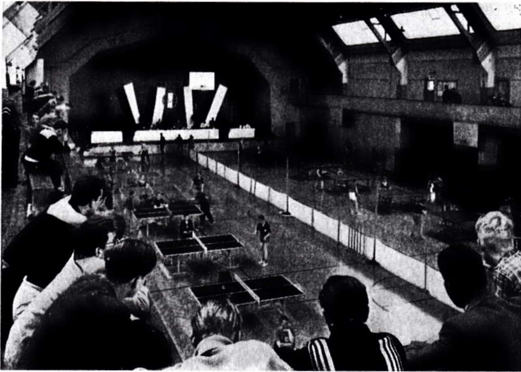
Bezirksoffenes Tischtennis-Turnier 1957 in der Miller-Hall.