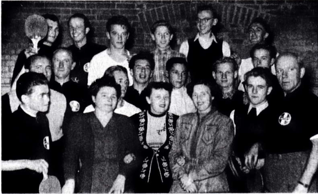
Gruppenbild aus dem Jahre 1953 der Tischtennisabteilung.