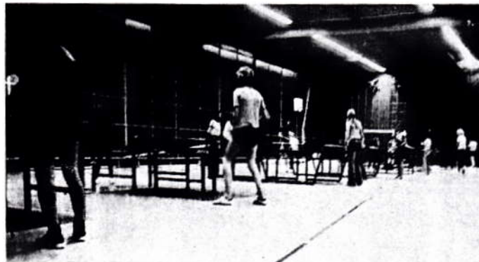
Training an den Platten

Die Abteilung wanderte mit ihrer Tischtennisplatte von der Garage über eine Baracke in den Aufenthaltsraum der Verkehrsbereitschaft. Hier wurden die ersten Freundschaftsspiele durchgeführt. Nachdem die Räumlichkeiten für Verbandsspiele zu eng wurden, zogen wir zur Gießener Rudergesellschaft und trugen hier unsere Verbands- und Freundschaftsspiele aus. Mittlerweile hatte sich die Abteilung zwei Tischtennisplatten zugelegt. Im Jahre 1951 kamen erstmals Bürger der Stadt und schlossen sich unserer Abteilung an. So nahm die Abteilung eine stetige Aufwärtsentwicklung, so daß auch die Räumlichkeiten nicht mehr ausreichten. Man versuchte in einem notdürftig hergerichteten Turnhallenraum